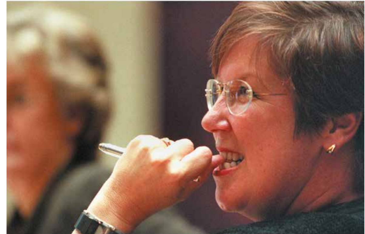
Minister Annemarie Jorritsma van Verkeer en Waterstaat luistert op 28 oktober 1996 in de Tweede Kamer naar het debat over de hogesnelheidslijn. Op de achtergrond minister Margreeth de Boer van Volkshuisvesting, Ruimtelijke Ordening en Milieubeheer.

Wat niemand haar had verteld, is dat je in een debat honderdduizend vragen krijgt. Je ambtenaren hebben de neiging die allemaal te willen beantwoorden, maar vaak kies je dan de verkeerde vragen. Na een paar maanden bedacht ze alleen nog mee te schrijven als ze emotie over het onderwerp in de stem van het Kamerlid hoorde. Dit betekende dat het ging om iets wat die persoon politiek belangrijk vond. “Die vragen noteerde ik met een steekwoordje. Daarmee vroeg ik de ambtenaren alleen die vragen te beantwoorden; op de rest zat niemand te wachten. Dit had ik best van tevoren willen weten. Daarom vertel ik het nu zelf vaak aan nieuwe collega’s.”