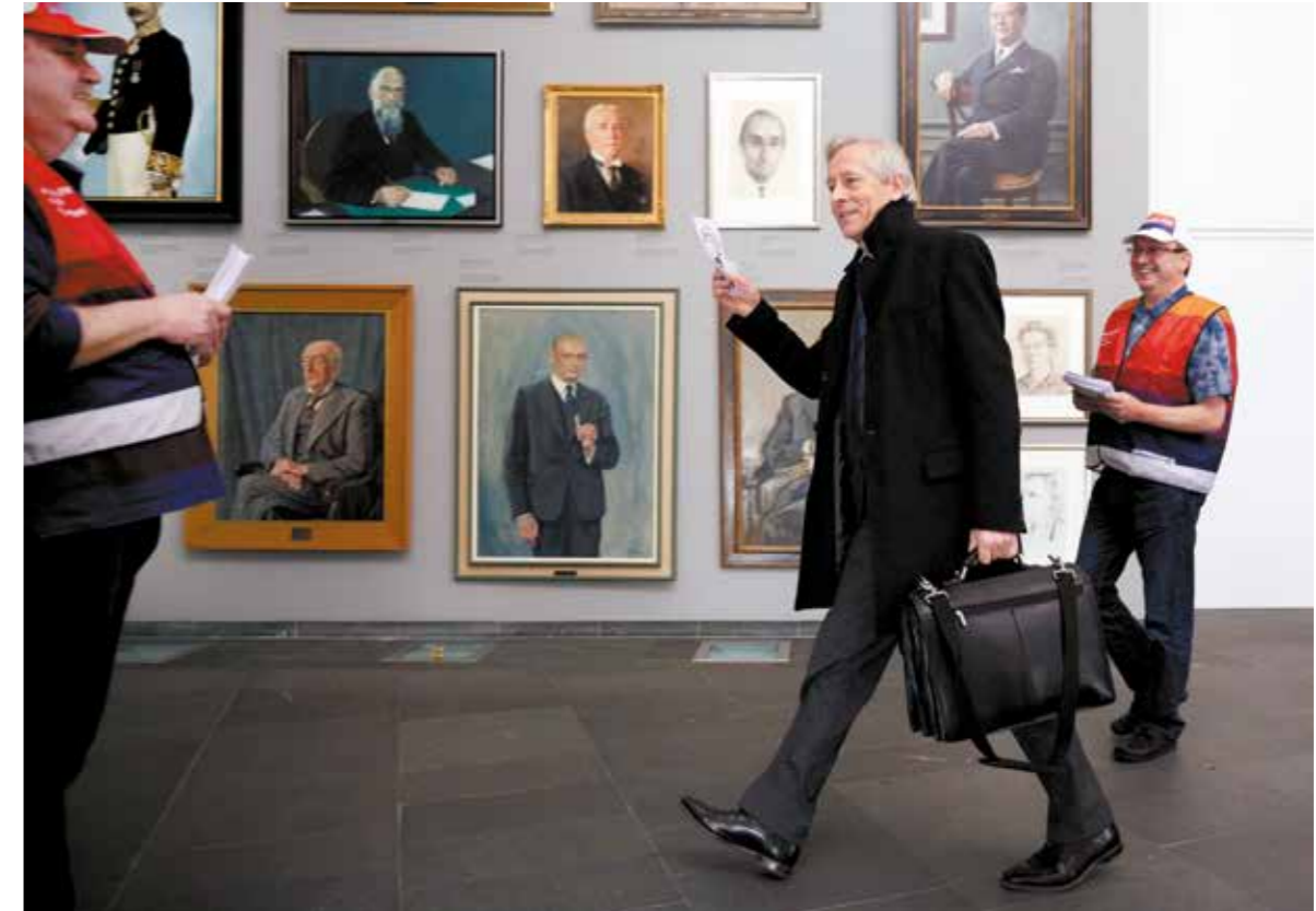
Secretaris-generaal Hans van der Vlist van het ministerie van Onderwijs, Cultuur en Wetenschap loopt op 8 december 2014 langs vakbondsleden die pal voor de schilderijen van oud-bewindspersonen actie voeren omdat de rijksambtenaren al ruim 1.400 dagen zonder cao zitten.

Ook in het SG-beraad zag hij in de loop der jaren een sfeer van meer openheid en transparantere discussies ontstaan. Een andere positieve ontwikkeling was de rol die de SG's kozen bij het samenstellen van de agenda voor de wekelijkse ministerraad. “Om de bewindslieden niet op te zadelen met onderliggende ambtelijke discussies, besloten we soms zaken van die agenda te halen. Die waren dan nog niet rijp voor besluitvorming en moesten we eerst zelf oplossen.”