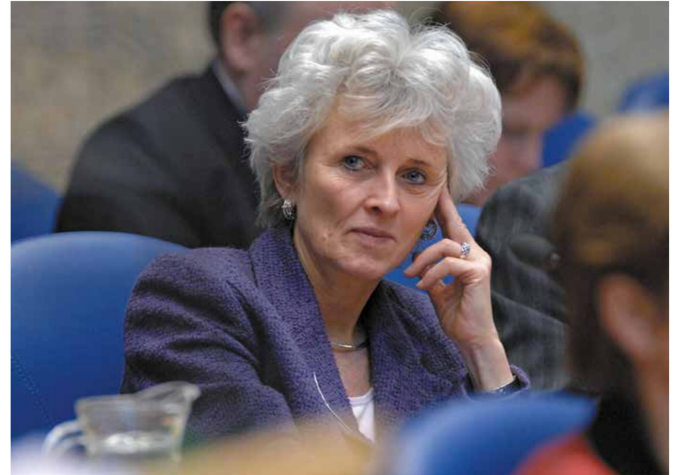
Minister Jacqueline Cramer van Volkshuisvesting, Ruimtelijke Ordening en Milieubeheer tijdens het debat over de regeringsverklaring van het kabinet-Balkenende IV, op 1 maart 2007.

Toen Cramer na drie jaar ministerschap de politiek verliet, had ze de smaak nét te pakken. Ze wist van alle hoeden en randen en had een band opgebouwd met haar collega’s en met de Eerste en Tweede Kamer. “Ik was in alle opzichten in mijn kracht gekomen en wilde in het laatste jaar graag verzilveren wat ik had beloofd. Toen ik door de val van het