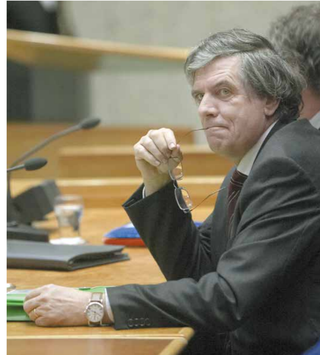
Minister Cees Veerman tijdens een overleg in de Tweede Kamer, op 6 februari 2007.

Op zijn tijd in Brussel kijkt Veerman met genoeg terug. Hij heeft er zijn ministerschap namens Nederland meerdere malen succesvol kunnen inzetten. Destijds waren er grote veranderingen op komst. Er kwamen nieuwe lidstaten en de landbouwsubsidierregels stonden zwaar ter discussie. Van oudsher maakten Duitsland en Frankrijk de dienst uit. Zo wilden Chirac en Schröder de landbouwuitgaven plafonneren, maar wel laten meestijgen met de inflatie. Veerman pleitte voor afschaffing. “Als vooruitstrevend land- en tuinbouwland werd Nederland serieus genomen, al vonden ze ons veel te radicaal in sommige opzichten.”