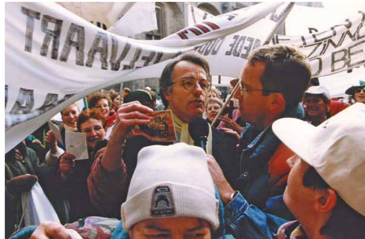
Zo'n tweeduizend boerinnen protesteerden op 1 december 1995 tegen het landbouwbeleid van het kabinet-Kok. Minister Jozias van Aartsen ontving een petitie en kon zich door de menigte boerinnen maar met moeite een weg banen op weg naar de ministerraad.

“Die 25 procent krimp leidde natuurlijk tot een opstand van jewelste in de sector. Men heeft mij toen wel misbruik van een crisis verweten. Maar het was voor mij volstrekt duidelijk dat er iets moest gebeuren.” Vol lof is de voormalig minister over de ‘fantastische ambtelijke ondersteuning’ die hij kreeg bij het formuleren van het wetsvoorstel. “De juridische afdeling, een creatie van Tjibbe Joustra, had briljant werk geleverd.”