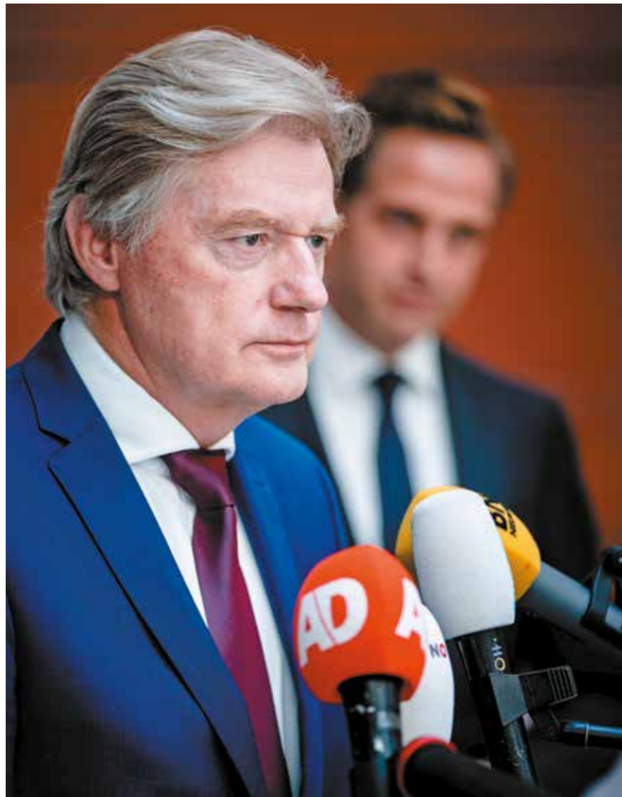
Minister Martin van Rijn en minister Hugo de Jonge staan op 25 juni 2020 de pers te woord in de hal van het ministerie van Volksgezondheid, Welzijn en Sport.

De eerste twee jaar van zijn staatssecretariaat ervoer hij het samenwerken in de politiek als fantastisch. “Ik vond dat met zulke grote hervormingen in de zorg, er een bredere overeenstemming moest zijn dan alleen die met de coalitiemeerderheid. Dit betekende veel praten met de constructieve vijf, zoals dat heette. Het samen met andere politieke partijen klussen aan en hervormen van het idee was een machtig mooie periode.”