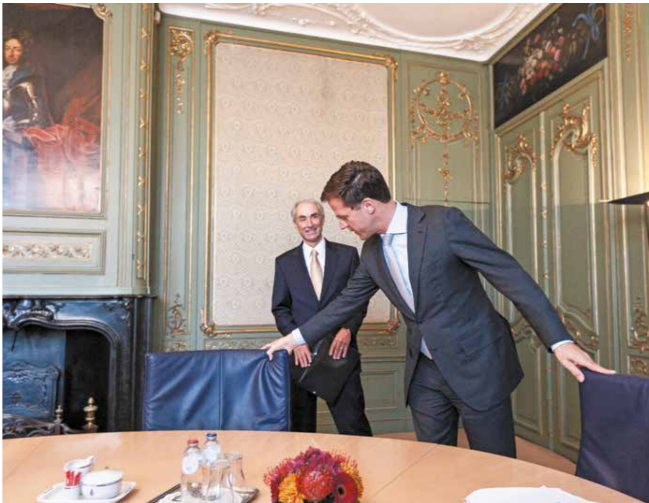
Formateur Mark Rutte ontvangt kandidaat-bewindspersoon Gerd Leers, beoogd minister van Immigratie en Asiel voor het kabinet-Rutte I, op 11 oktober 2010.