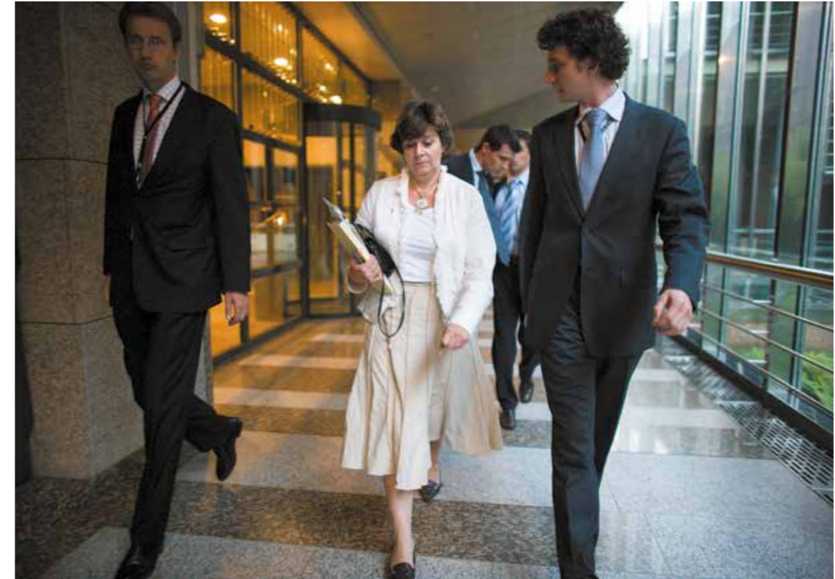
Geflankeerd door haar beveiligers verlaat minister Rita Verdonk op 29 juni 2006 om halfzes 's ochtends de Tweede Kamer na een spoeddebat over haar handelswijze rond de Nederlandse nationaliteit van Hirsi Ali.

Verdonk besloot het anders aan te pakken. Ze stelde voor om te gaan kijken welke groepen het qua integratie juist goed doen in de samenleving. “Ik dacht, misschien kunnen we zorgen dat ze van elkaar leren, of wellicht gaan wij hierdoor de mensen meer waarderen die het goed doen. Maar toen kreeg ik van mijn partijgenoot Hans Dijkstal te horen dat ik mensen een Jodenster wilde opplakken. Dat was zo bizar.”