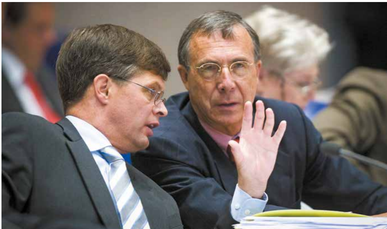
Minister Laurens Jan Brinkhorst van Economische Zaken overlegt met minister-president Jan Peter Balkenende tijdens de Algemene Beschouwingen, op 20 september 2005.

regel dat een kilometer rondom een boerderij direct alles geruimd moet worden wat evenhoevig is. Een paar dagen na het ruimen bleek voorbij die cirkel echter nog een boerderij besmet en moest er een nieuwe cirkel worden gemaakt. “Zo liepen we telkens een aantal dagen achter de feiten aan.”