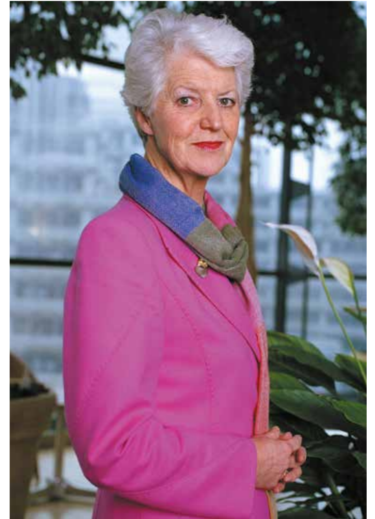
Minister Sybilla Dekker in Den Haag, op 13 februari 2003.

Dat ze haar ministerschap niet kon afmaken, betreurt ze nog steeds. Vooral omdat ze net voor een half jaar stond waarin ze spijkers met koppen kon slaan: “Ik stond voor een afhechting van de beleidslijnen naar de woningcorporaties, de ruimtelijke ordening en nog een aantal zaken. De wet op de RO moest erdoor. Dit werd door mijn