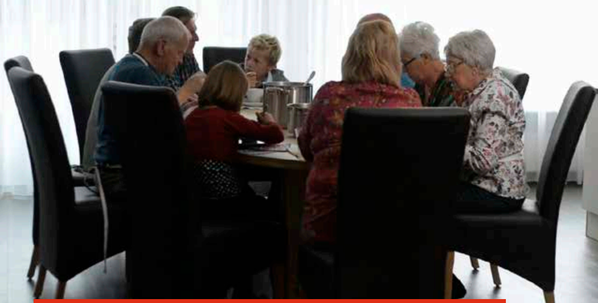
Foto van Thuishuisproject, een initiatief ondersteund door actieve burgers voor alleenstaande ouderen met een smalle beurs. Foto is een still uit de gelijknamige Thuishuisfilm: 'Oud worden doe je liever niet alleen', YUNE, A'dam 2012. Thuisinwelzijn.nl.

37 Aldus P.F. Thomése in de Volkskrant (16-10-2009).