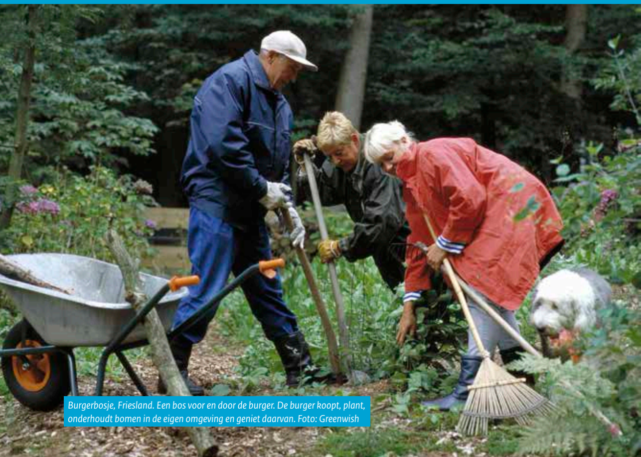
Burgerbosje, Friesland. Een bos voor en door de burger. De burger koopt, plant, onderhoudt bomen in de eigen omgeving en geniet daarvan.

Niet alleen bijdragen in de tekst, maar ook de illustraties zijn het resultaat van coproductie met maatschappelijke organisaties, waarvoor dank.