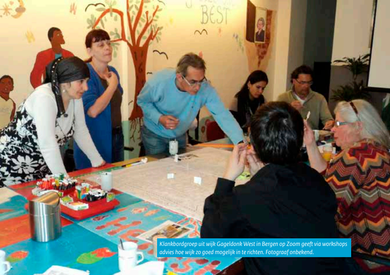
Klankbordgroep uit wijk Gageltonk West in Bergen op Zoom geeft via workshops advies hoe wijk zo goed mogelijk in te richten.