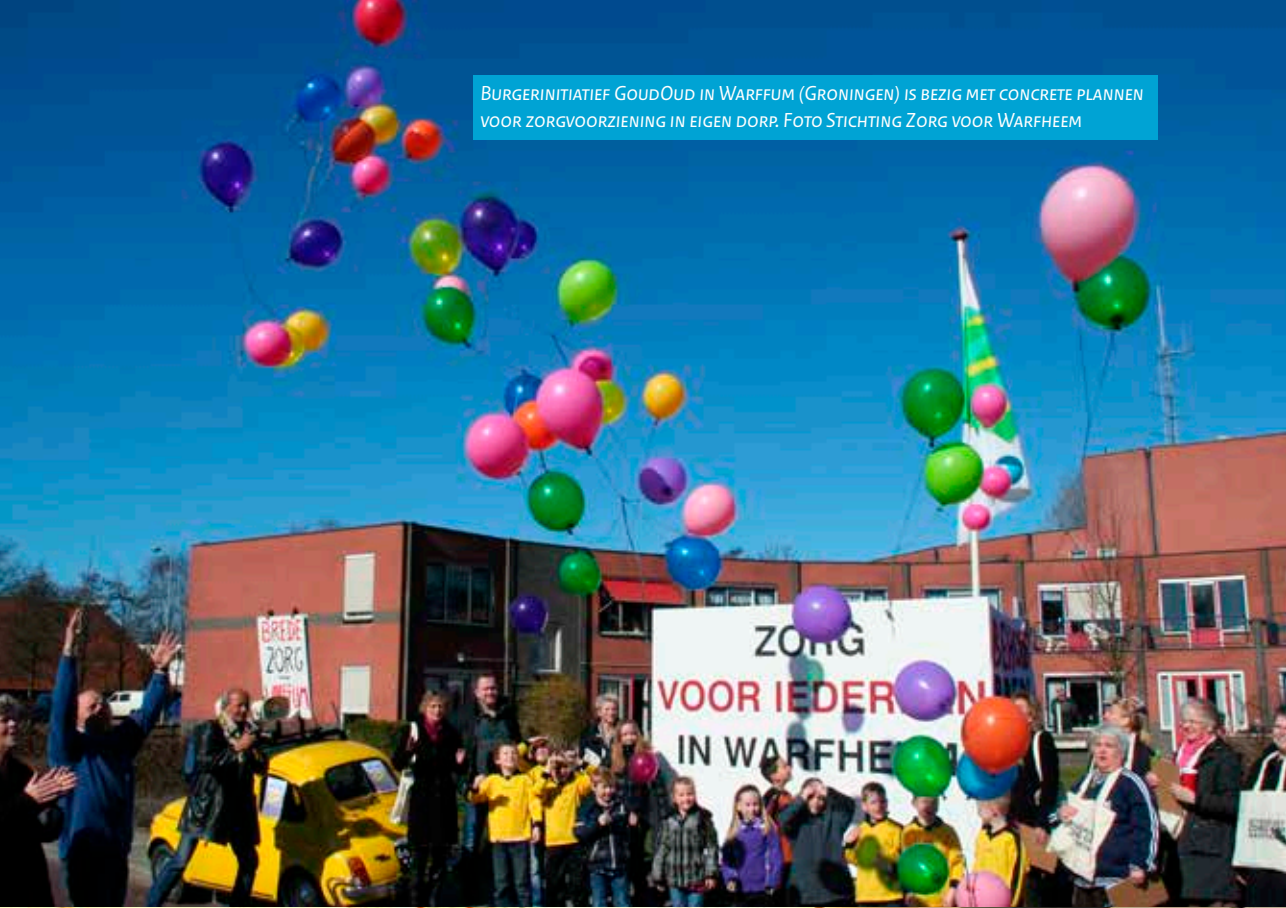
BURGERINITIATIEF GOUDOUD IN WARFFUM (GRONINGEN) IS BEZIG MET CONCRETE PLANNEN VOOR ZORGVORZIENING IN EIGEN DORP.