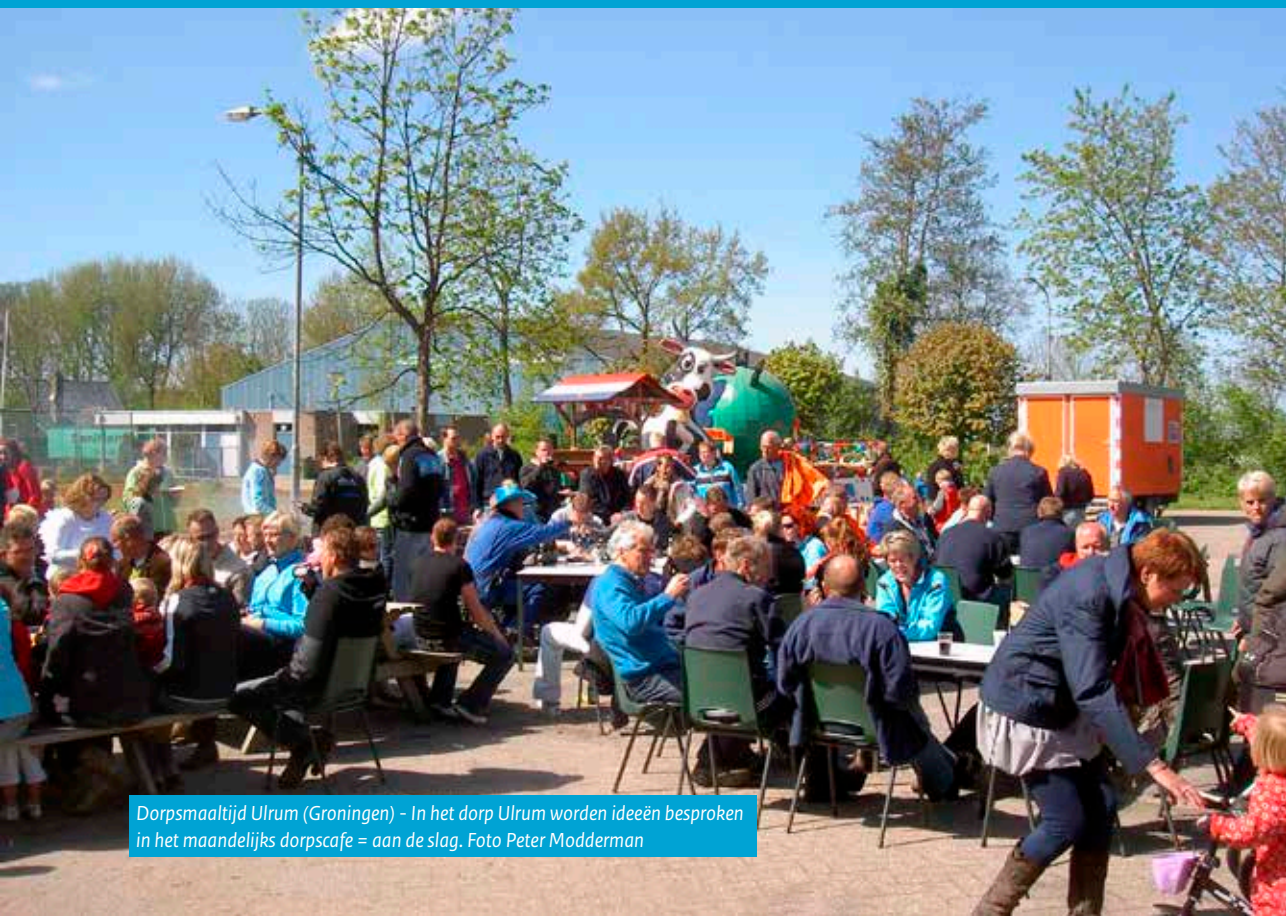
Dorpsmaaltijd Ulrum (Groningen) - In het dorp Ulrum worden ideeën besproken in het maandelijks dorpscafe = aan de slag.

‘Het Proces’ is – onder meer – een grote aanklacht tegen (ambtelijke) processen waar je als burger nauwelijks invloed op hebt.