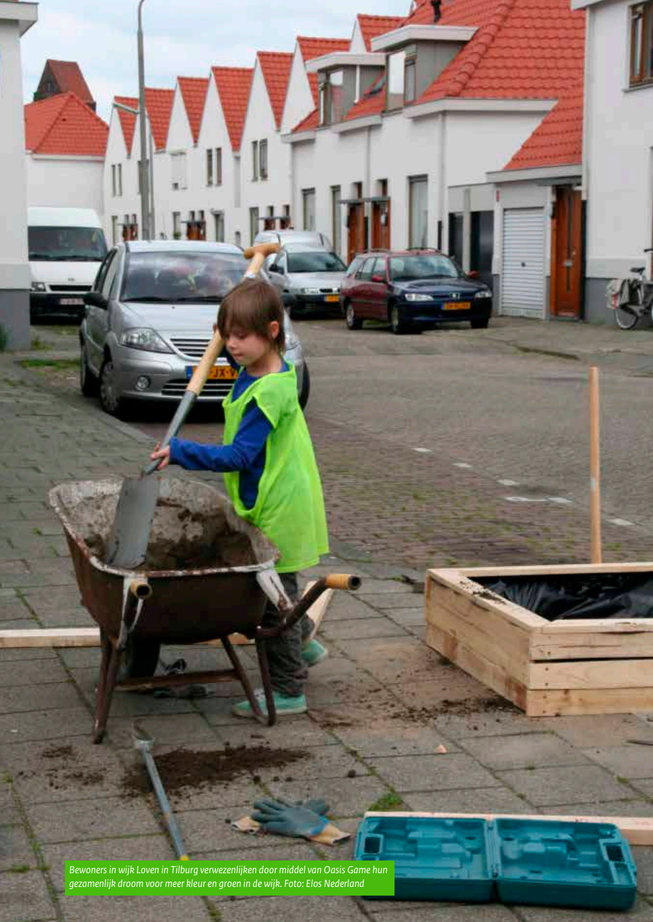
Bewoners in wijk Loven in Tilburg verwezenlijken door middel van Oasis Game hun gezamenlijk droom voor meer kleur en groen in de wijk.